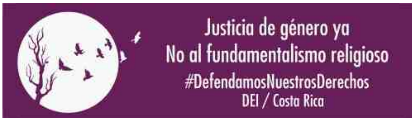
Campaña «Fundamentalismo y Derechos Humanos de las Mujeres: Acciones Afirmativas», Departamento Ecuménico de Investigaciones (DEI), Costa Rica.