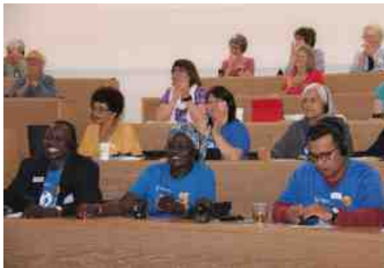
Conferencia de Mujeres Mission 21, Aarau 2018

Del Taller «Ética del cuidado» presentamos el folleto Caminando su historia – peregrinaje de justicia y paz, con relatos sobre visitas a mujeres y niñas en zonas de conflicto. Los relatos muestran que la educación es crucial para empoderar a las niñas. Se necesitan comunidades resilientes y acogedoras, capaces de escuchar a las víctimas, fortalecerlas y sanar sus traumas. El ser humano no puede satisfacer sus necesidades sin la ayuda de otras/os. (Esther Gisler)