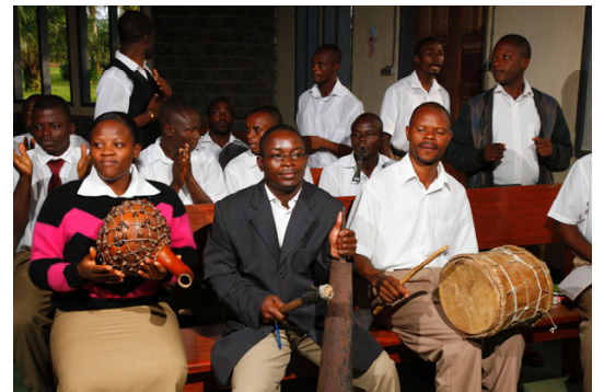
Die Studierenden im PTS bei der Morgenandacht