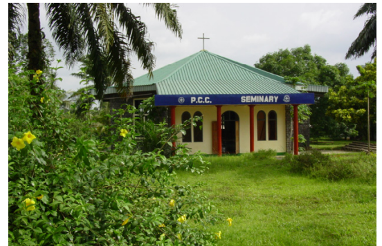
Kapelle im Theologischen Seminar in Kumba