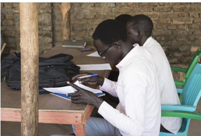
Studenten beim Unterricht am Nile Theological College