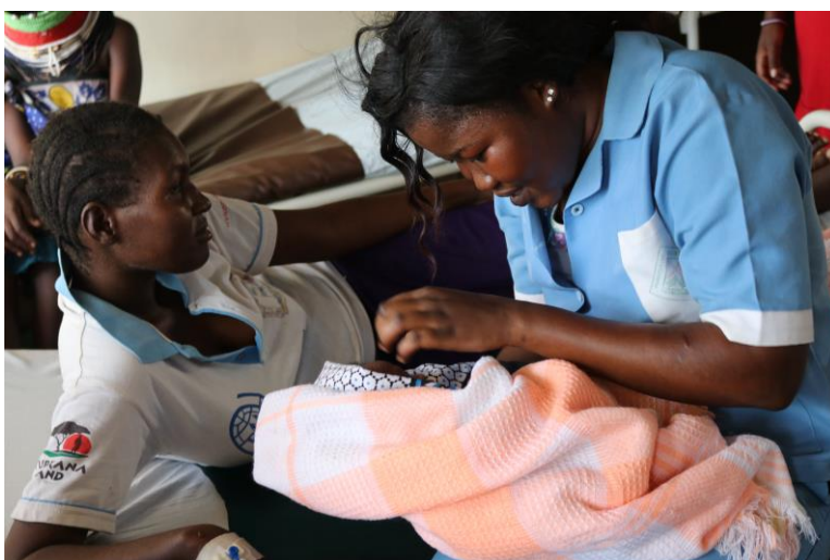
Eine Hebamme in Ausbildung besucht ein Neugeborenes und seine Mutter.