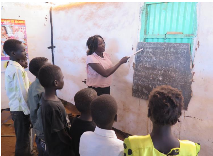
Unterricht im Krieg: Schule in einem Flüchtlingslager in Juba. Bild aus dem Projekt Nr. 179.1010: Bildung für die Zukunft.

Nach fast 50 Jahren Bürgerkrieg wünschen sich die Menschen nichts sehnlicher, als in Frieden zu leben. Mission 21 unterstützt das Friedensengagement ihrer Partnerkirche, der Presbyterianischen Kirche des Südsudan (PCOSS), der Presbyterianischen Organisation für Sofort- und Entwicklungshilfe (PRDA) sowie des Südsudanesischen Kirchenbunds (SSCC), der 2015 den «Aktionsplan für Frieden» lanciert hat. Die Friedensarbeit zieht sich wie ein roter Faden durch die Arbeit. Die PCOSS, ursprünglich beheimatet in der stark vom Krieg betroffenen Region Greater Upper Nile, musste selbst fliehen und agiert nun dort, wo die Gemeinde verstreut ist – in anderen Landesteilen und in Flüchtlingslagern im Inland und in den Nachbarstaaten. Sie hat mit bewundernswerter Flexibilität Projekte wieder aufgenommen und unterstützt die notleidende Bevölkerung. Der SSCC erreicht die Menschen überall im Land. Die Kirchen geniessen als einzige Institution noch das Vertrauen der Bevölkerung. So tragen unsere Partnerkirchen wesentlich dazu bei, dass die Menschen im Südsudan nicht aufgeben und den Glauben an Frieden und Wiederaufbau nicht verlieren.