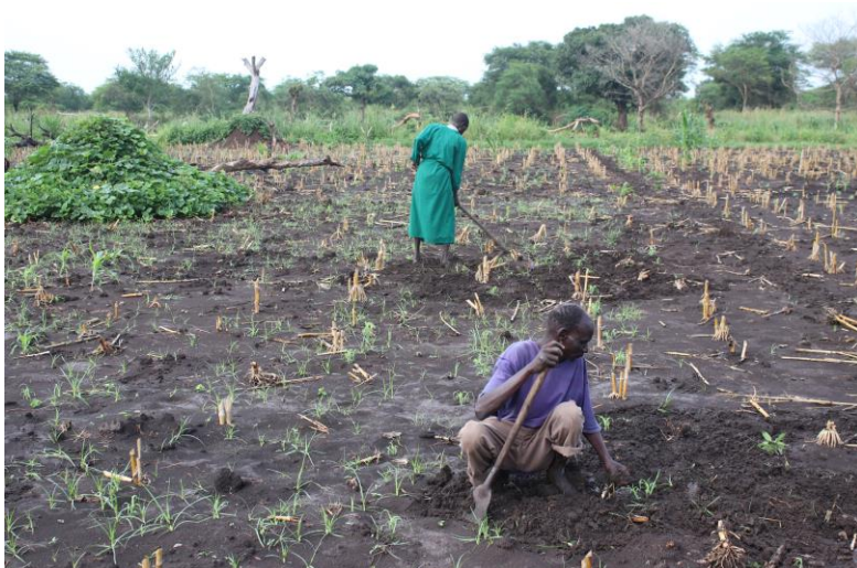
Bauern in Pochalla bei der Feldarbeit

Die gewaltsamen Auseinandersetzungen, die seit Ende 2013 den Südsudan heimsuchen, verschärfen die Sicherheits- und Versorgungslage der Bevölkerung. Wovon sollen die Menschen insbesondere auf dem Land leben? Wie kann eine medizinische Grundversorgung sichergestellt werden? Mit diesen Fragen beschäftigt sich seit vielen Jahren die Presbyterian Relief and Development Agency (PRDA) als Partnerorganisation von Mission 21. In Pochalla, nahe der äthiopischen Grenze, betreibt die PRDA mit Unterstützung von Mission 21 ein grosses integriertes Projekt zur ländlichen Entwicklung, um die Gesundheit und Ernährung für die Bevölkerung in der Region zu sichern und den Familien zu einem besseren Haushaltseinkommen zu verhelfen. Die Ernährungssicherung wird ganzheitlich angegangen durch Massnahmen in der Landwirtschaft und Bildung sowie betreffend den Zugang zu Wasser und Hygiene.