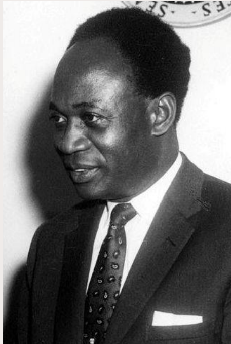
Kwame Nkrumah, 1961 ( https://commons.wikimedia.org/wiki/File:Kwame_Nkrumah_(JFKWHP-AR6409-A).jpg )