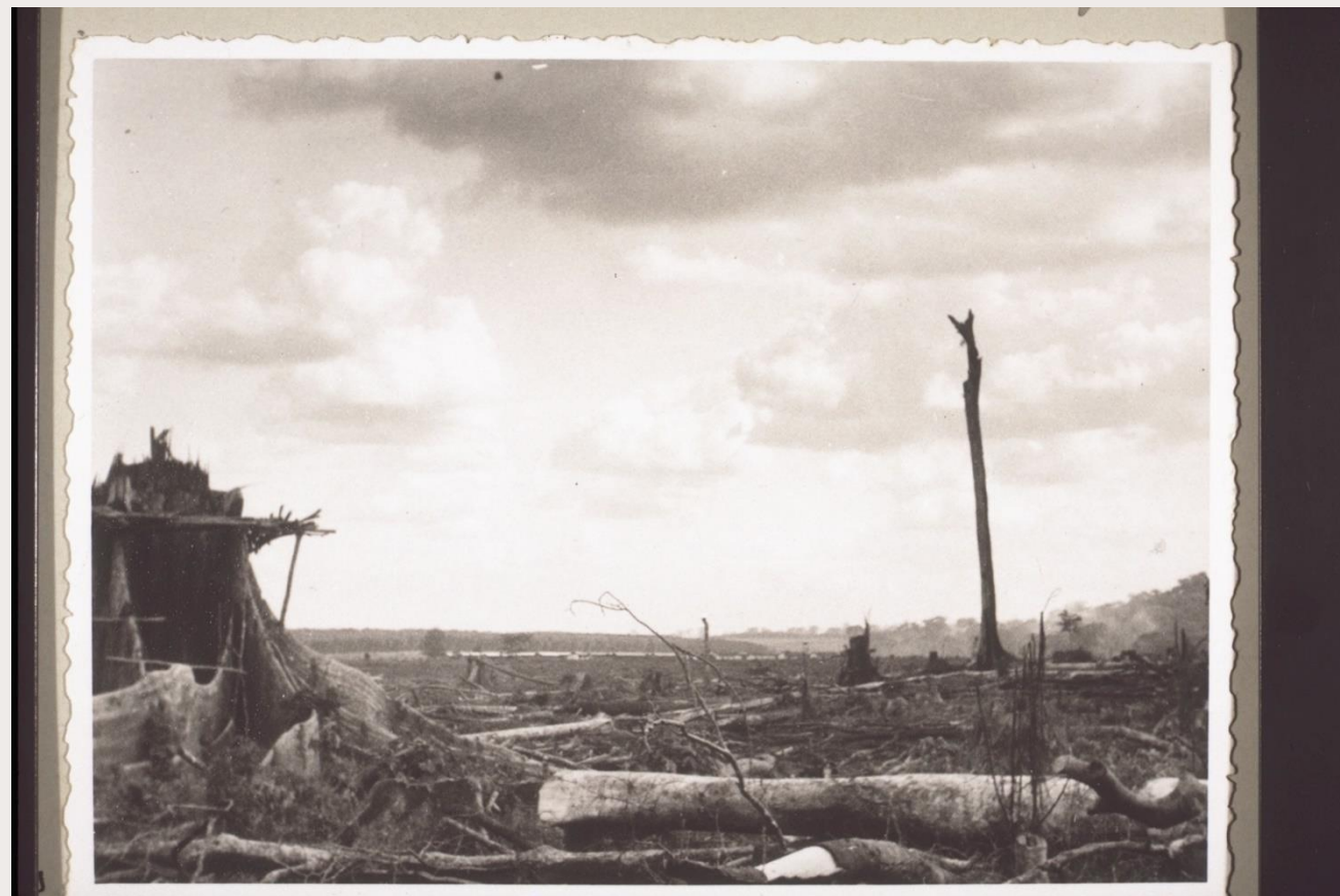
„Der Urwald muss weichen, das Land will mehr Pflanzungen“, 1924-1945 (BMA E-30.83.009)