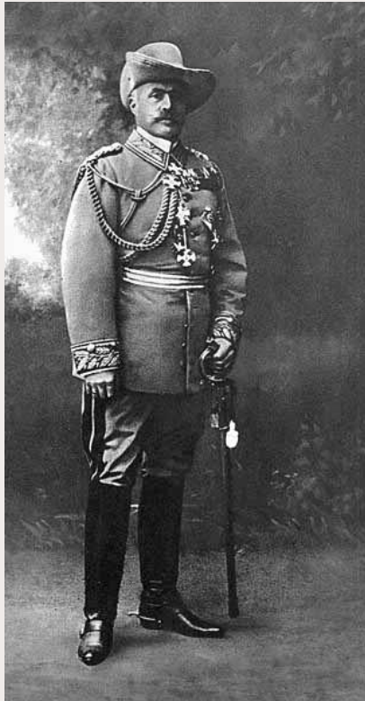
Lothar von Trotha, 1905