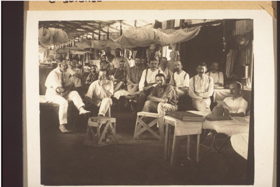
„Missionars-Baracke in Ahmednagar“, 1914-1918