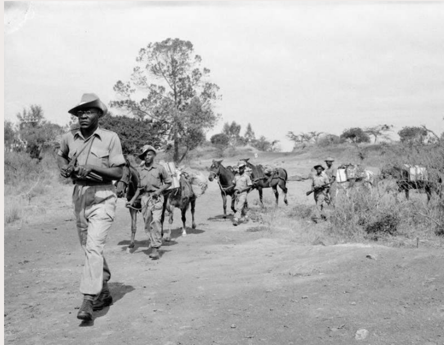
Troops of the King's African Rifles on watch for Mau Mau rebels, 1957 ( https://commons.wikimedia.org/wiki/Category:Mau_Mau_Uprising#/media/File:KAR_Mau_Mau.jpg )