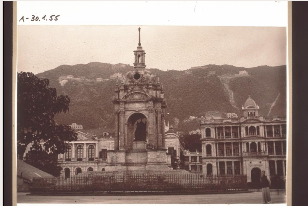
„Denkmal der Königin Viktoria von England im Hafen von Hongkong (China)“, 1901-1903