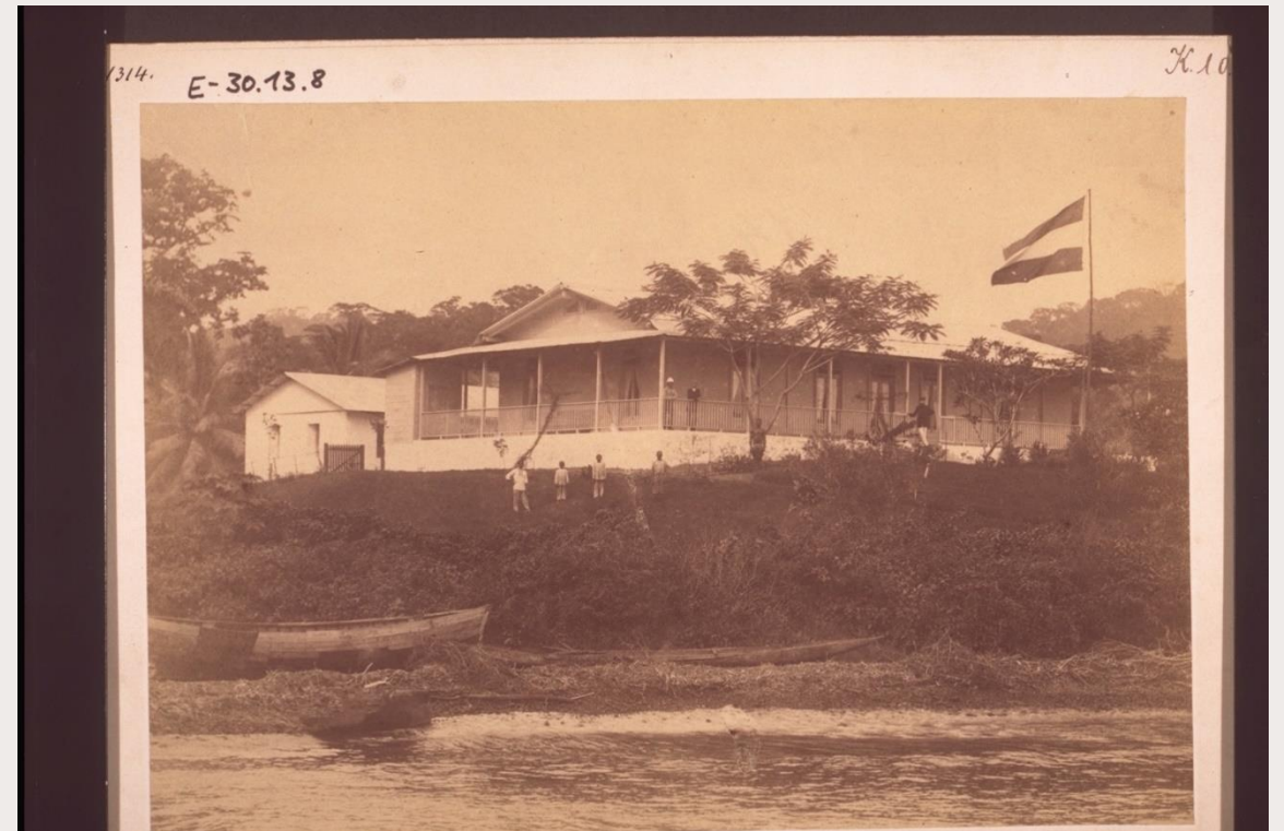
„Missions-Haus in Victoria (Kamerun) - vom Land aus gesehen“, 1886-1889