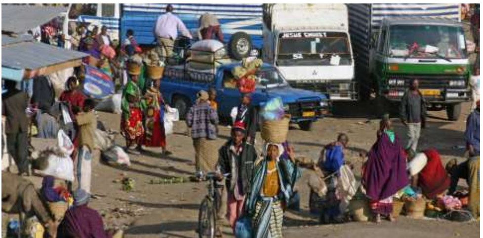
Marktszene und Glaube mitten im Alltag

Die Studienreise führt in diesen weithin unbekanntem Landesteil mit seiner sprichwörtlichen Naturschönheit und Gastfreundschaft. Sie ermöglicht intensive Begegnungen mit Land und Leuten, mit den Gemeinden der Moravian Church und ihrer Geschichte. Die Reise gibt Einblicke in die diversen Bildungseinrichtungen und Spitäler der Kirchen und in ihre beeindruckenden Sozialprojekte unter dem Motto «Leave No One Behind».