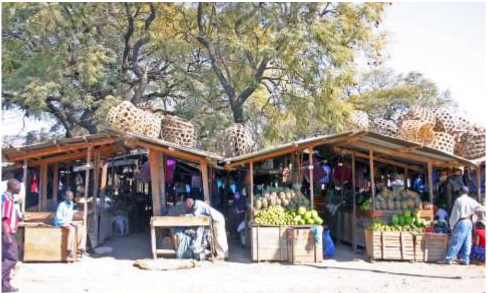
Markt in Mbeya