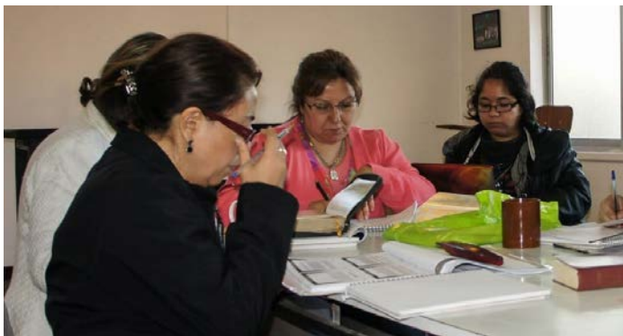
Bibelexegese in Lateinamerika