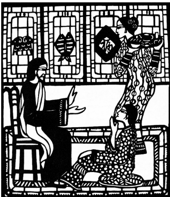
Fan Pu, China: Marta and Mary (1996) Aus: Fan Pu (2010): The Way of My Heart. The Paper Cut Art of Fan Pu, Nanjing, 59 © Fan Pu