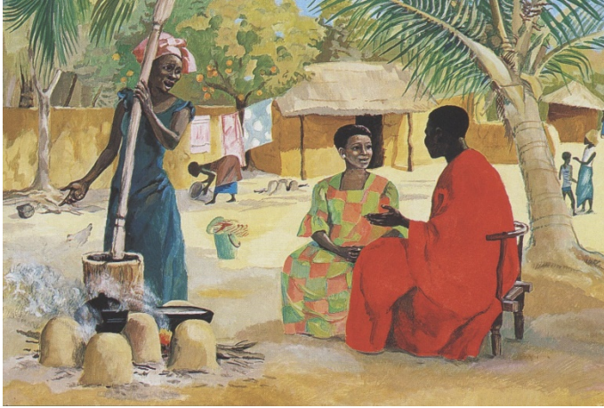
Jesus-Mafa-Projekt/Bénédite de la Roncière, Kamerun: Marta and Mary (1976)

Die Bilder finden sich zum Projizieren oder Ausdrucken am Ende dieser Datei.