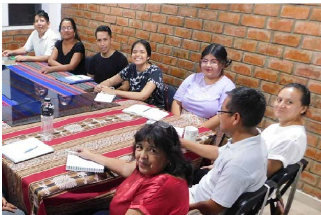
Bibelexegese in der UBL in Costa Rica

Die Lateinamerikanische Bibeluniversität (UBL) ist eine theologische Hochschule in San José, Costa Rica. Projektnummer Mission 21: 400.1020