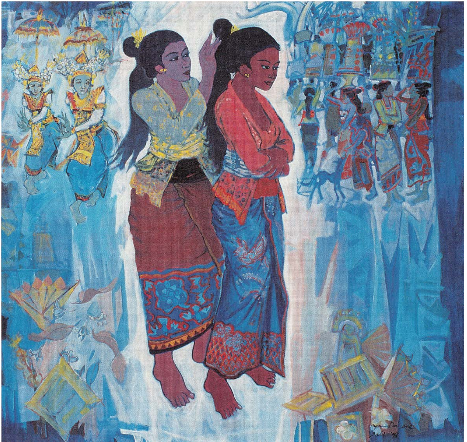
Nyomen Darsane, Bali/Indonesien: Mary and Marta (1992)