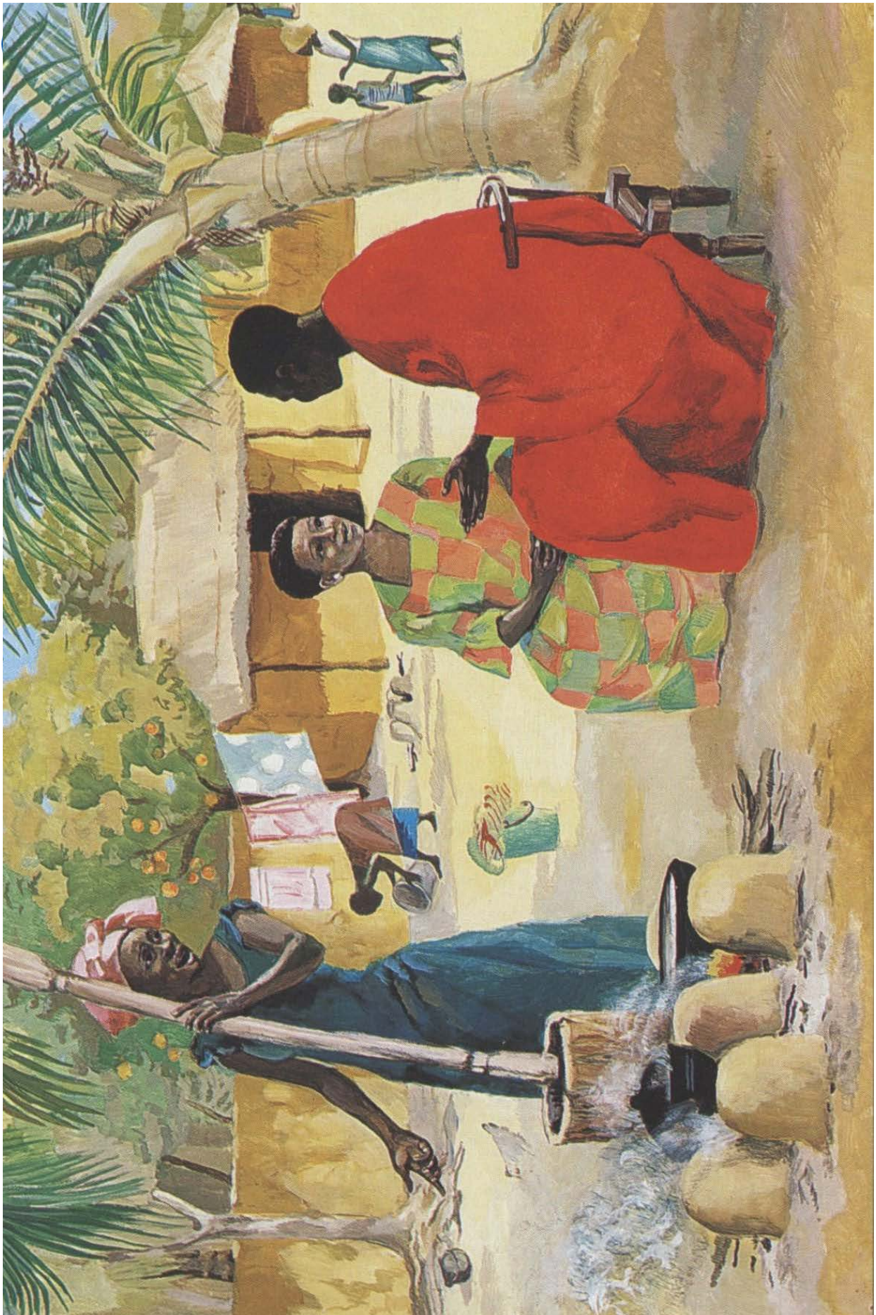
Jesus-Mafa-Projekt/Bénédite de la Roncière, Kamerun: Martha and Mary (1976)