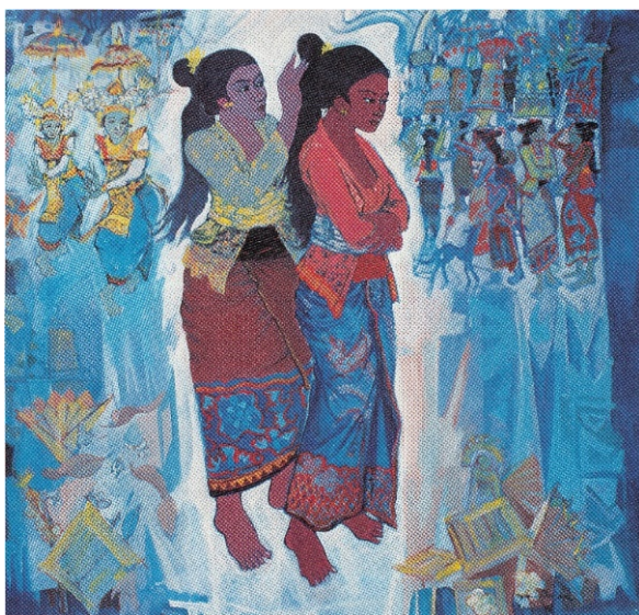
Nyomen Darsane, Bali/Indonesien: Mary and Marta (1992) © Sammlung Gudrun Löwner

Spannend ist es, Kunstwerke aus anderen Kulturkontexten beizuziehen: